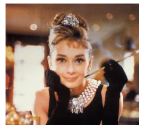
Exposition Audrey Hepburn