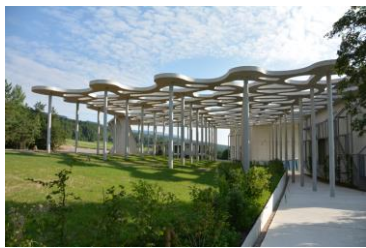
Maison de l'écriture