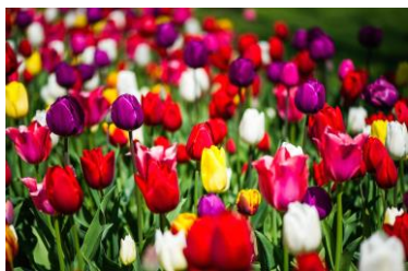
Fête de la tulipe