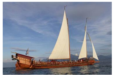
Galère la Liberté