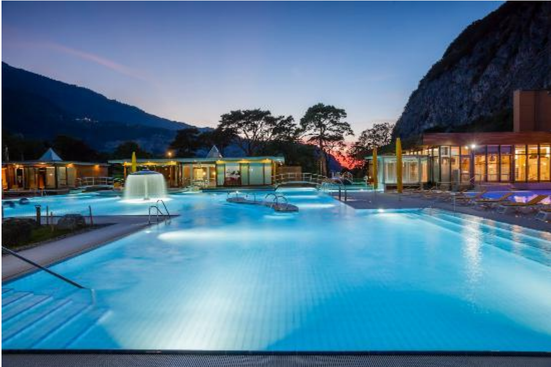
Figure 1 : Centre thermal de Lavey