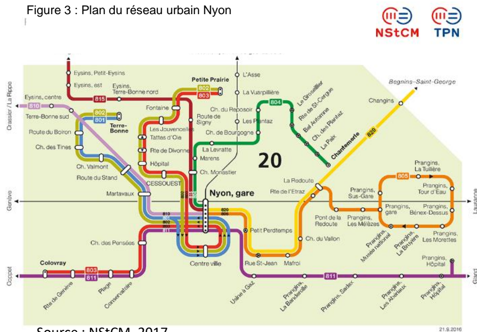
Figure 3 : Plan du réseau urbain Nyon

Le Paléo Festival Nyon a pour avantage d'être relativement bien situé en Suisse romande et desservi par les transports publics. La ville de Nyon possède déjà un réseau urbain bien organisé qui permet une facilité d'accès au festival grâce au train NStCM. (Figure 3).