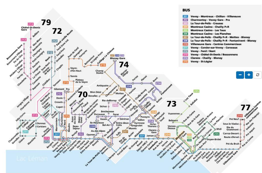
Figure 2 : Réseau des VMCV

Le principal avantage de Montreux réside dans sa situation géographique. Avec leurs trois lignes (Figure 2), les VMCV agissent au niveau local et font le lien avec les visiteurs venant des alentours du festival. La gare de Lausanne agit au niveau national en tant que point de convergence pour les festivaliers empruntant le rail et ensuite les redirige sur Montreux. Les visiteurs venant du Valais et du Chablais arrivent directement à Montreux. L'évènement est également accessible à l'international par le rail via l'aéroport de Genève (MJF. 2017). Ces infrastructures préexistantes permettent de désengorger le trafic et d'éviter les embouteillages sur les principaux axes routiers, elles facilitent aussi l'accès au festival et d'assurer la sécurité des spectateurs.