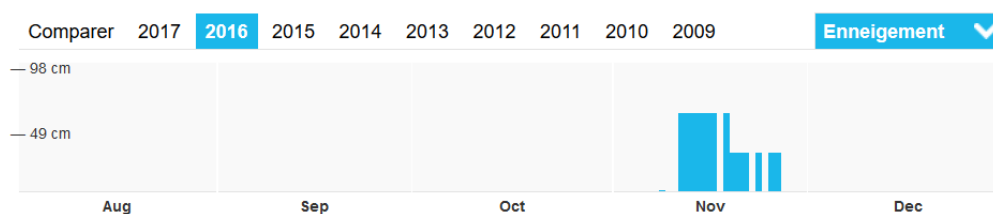
Tableau 1 : historique 2016 de l'enneigement à Crans-Montana d'août à décembre

Située à 1 500 mètres d'altitude, la station touristique s'est faite une renommée internationale grâce à ses compétitions de ski et de golf. Sports d'été, d'hiver et aériens, festivals, opéras, etc., la destination attire tout type de visiteurs grâce à son large éventail de divertissement (a. Crans-Montana, 2017). En effet, habitée de 6 500 habitants en moyenne à l'année, elle peut, durant les pics touristiques, atteindre une population de 50 000 personnes (b. Crans-Montana, 2017).