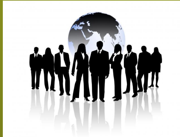
Business man/ women