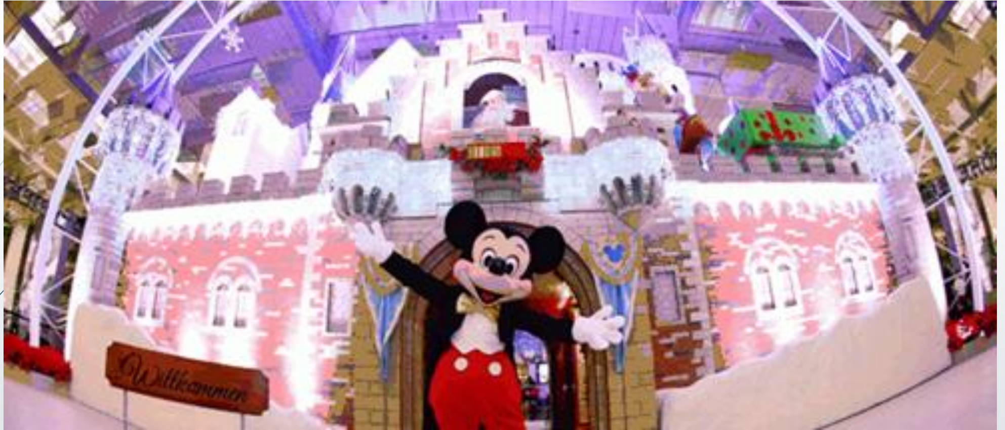
Märchenschloss in Singapur